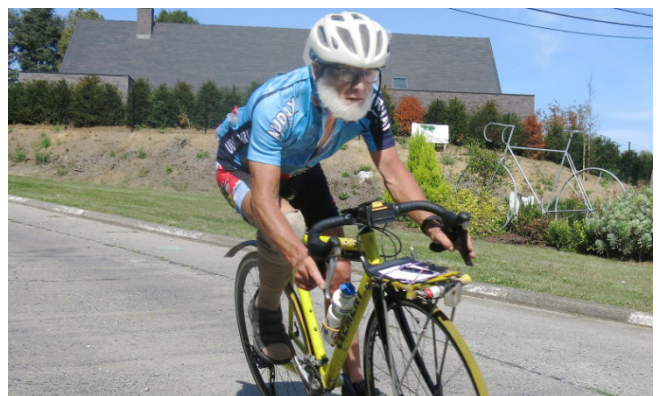
4) Et autant de descentes vertigineuses via Jubaru.