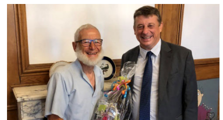
7) et les compliments de Polo !