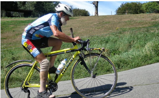
3) Avec 40 passages des lacets du Reposoir à Kain.