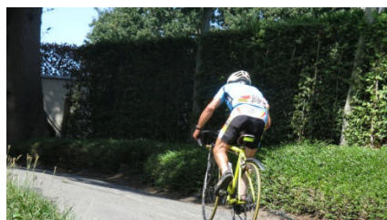
6) avec 40 fois le même sommet...